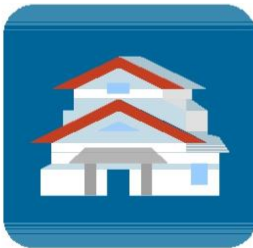
図 1 家 図版説明句は 8 ポイント位