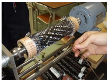
フィラメント・ワイン ディング(FW)成型法